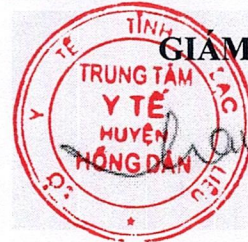
BS CKII. LÂM HOÀNG THỐNG